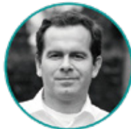
Jorge Gutiérrez Proyectos