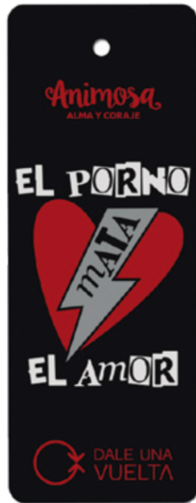
Etiqueta diseñada por la marca Animosa para una promoción de camisetas